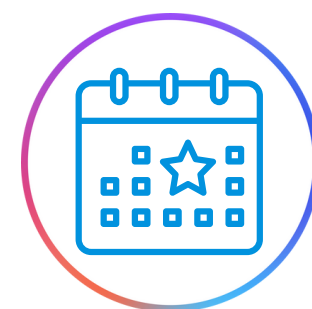
Activaciones y eventos