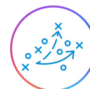
Estrategias de ventas