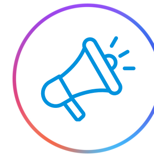
Publicidad y pautas