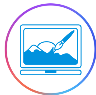
Diseño gráfico y web